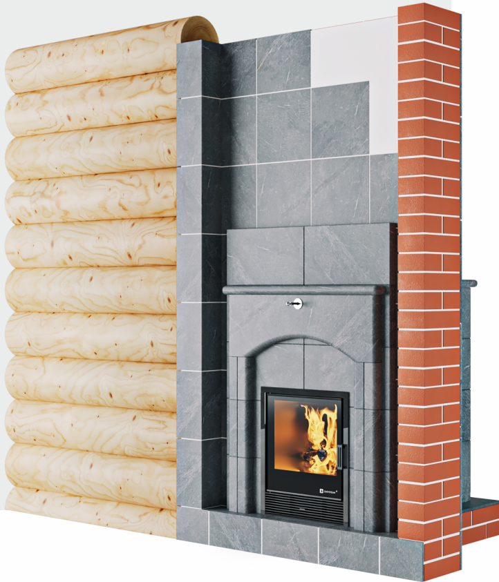
СХЕМА СБОРКИ ПОРТАЛА ИЗ ПРИРОДНОГО КАМНЯ